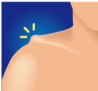
鎖骨遠位端の突出