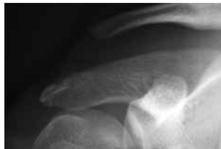
肩鎖関節脱臼のX線像