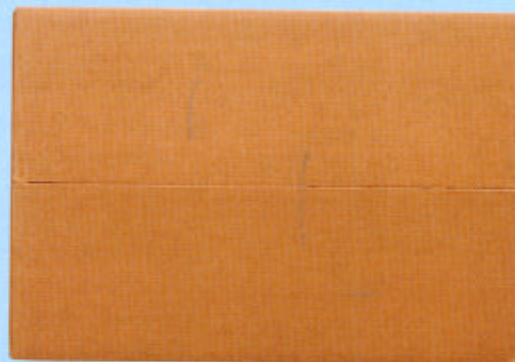
天面 ※天面の文字は削除しました。