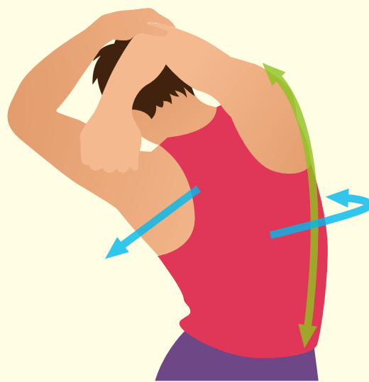
肩周囲筋(広背筋)のストレッチ

方法 右肩を上げ、肘を曲げた状態で図のような姿勢から右肘を左側に倒し体を左へ曲げる。