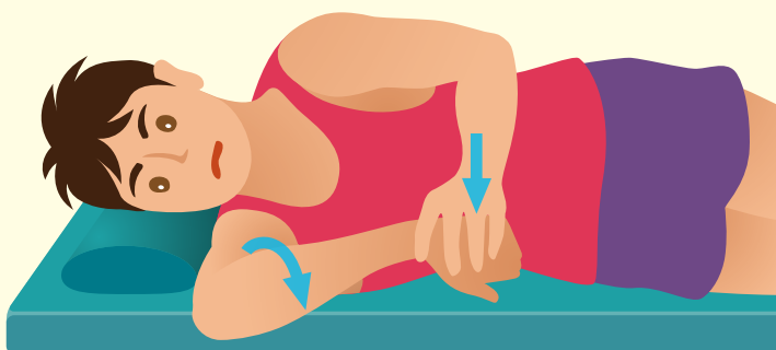
肩後方のストレッチ

方法 右を下に横になり肩と肘をそれぞれ90度曲げた状態で手首を下に押さえて肩を内側にひねる。