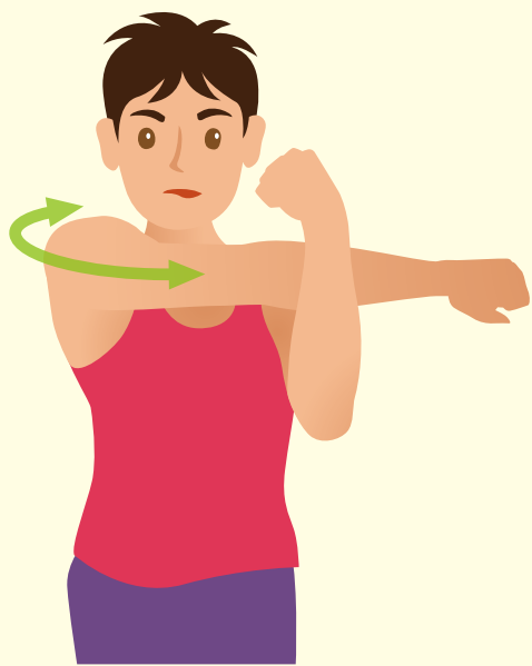
肩後方ストレッチ

ストレッチの目的は胸郭(胸)、肩甲骨、胸椎(胸の背骨)の動きを良くして周りの筋肉の緊張を取ります。