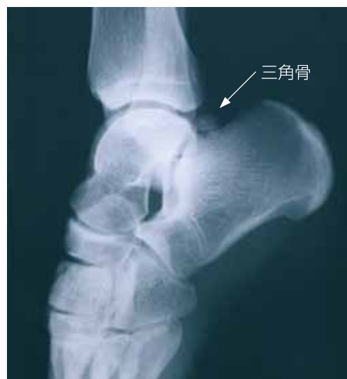
三角骨が原因と考えられる症例のX線写真