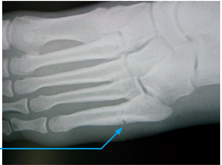
第5中足骨近位骨幹部疲労骨折例

X線撮影を行い骨折の部位や骨折の状態をみて診断します。MRI検査などを行う場合もあります。