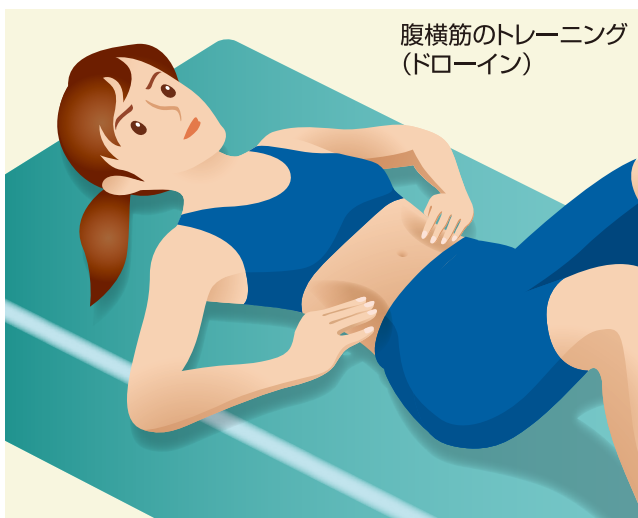
腹横筋のトレーニング (ドローイン)