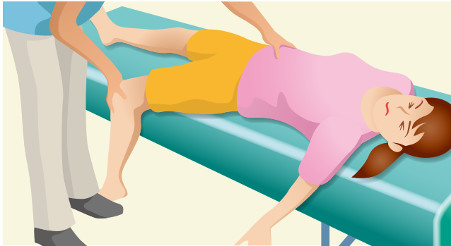
腸骨回旋ストレステスト (Gäenslen test)