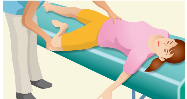
腸骨開排ストレステスト (Patrick test)