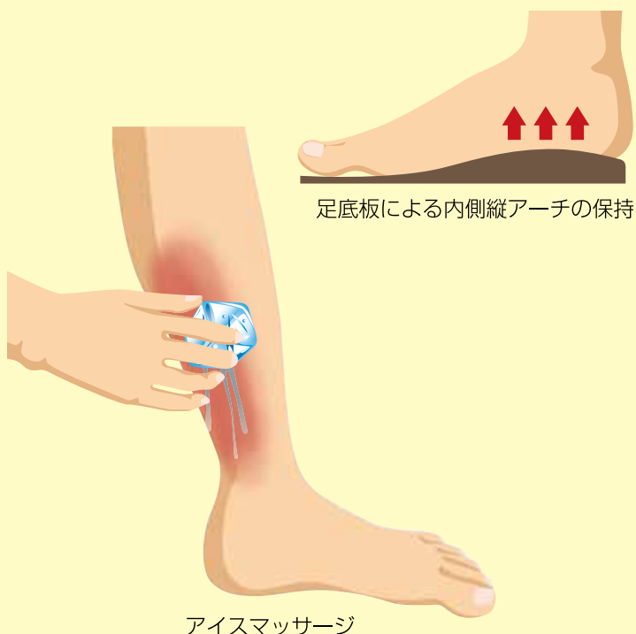
アイスマッサージ

痛みが強い場合は慢性化を避けるために運動量を減らす必要があり、アイスマッサージや外用薬の使用、足底や足関節周囲の筋肉の強化やストレッチを行います。足底板も効果的で、クッション性が良くかかとの安定したシューズを選ぶことも重要です。