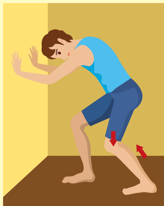
ヒラメ筋のストレッチ(膝を曲げる)