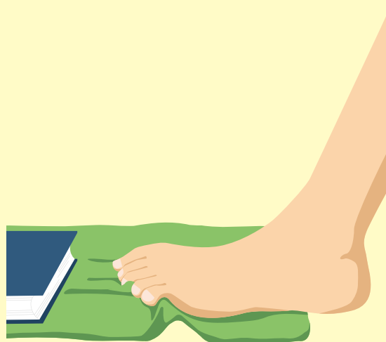
タオルギャザー(足底の筋肉の強化)